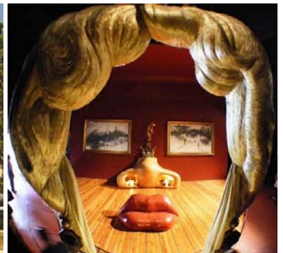
Figueras – Musée Dalí