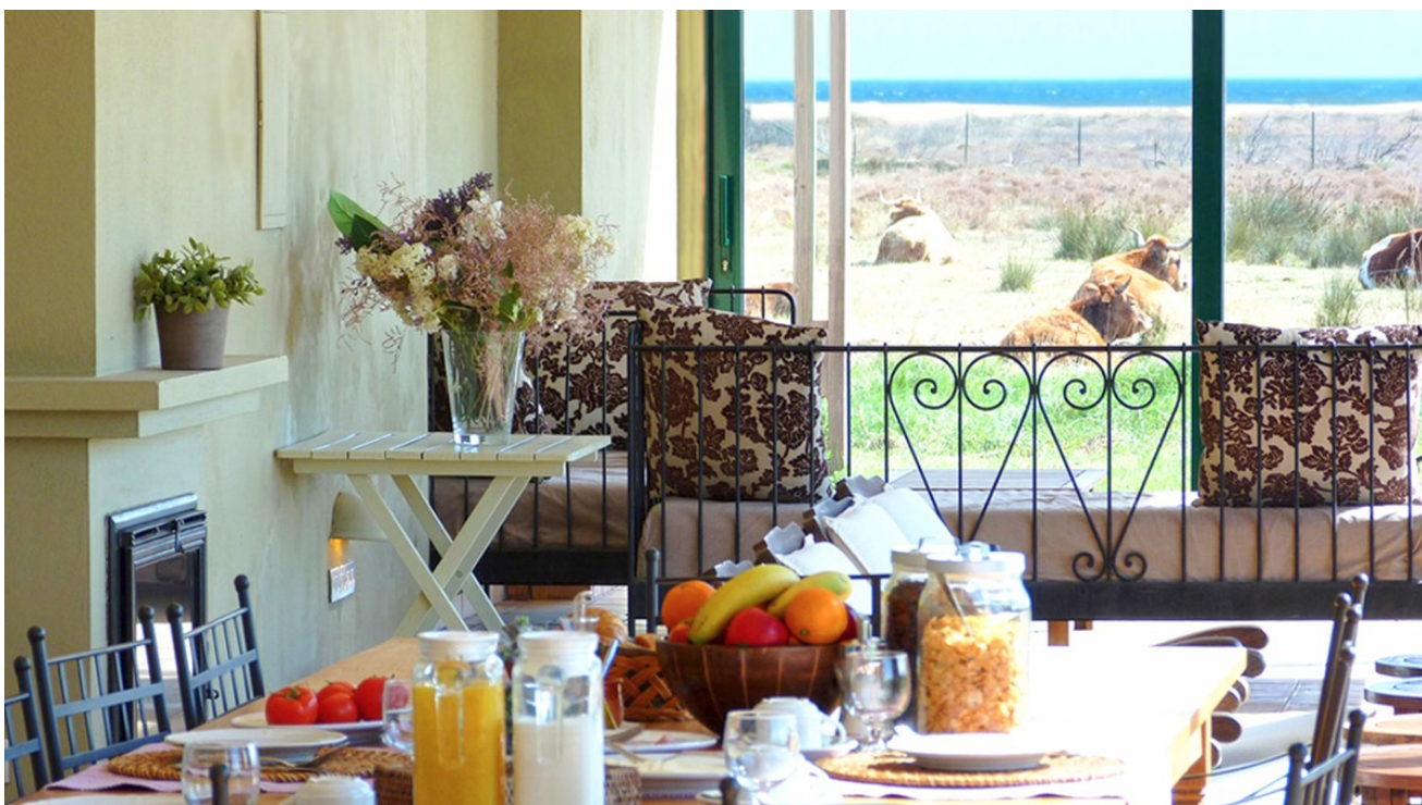
Petit-déjeuner sous la véranda...